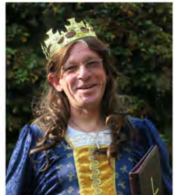
Kaiserin Bertha, Gemahlin von Heinrich IV., bittet zur Audienz.