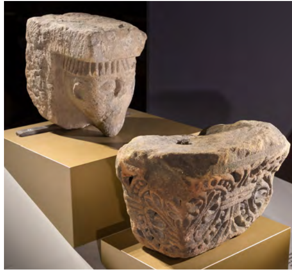
Reste der Johanniskirche: Bestienkopf und ornamentiertes Gesimsstück