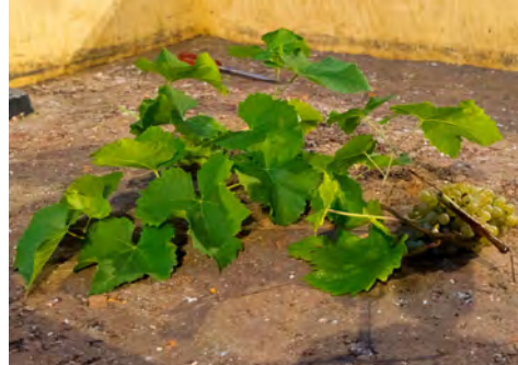
Laub von einem Weinstock