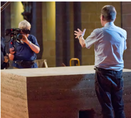
Groß war das Medieninteresse am Altarbau.

Mit großen Schritten gehen wir nun auf Weihnachten zu. Ich lade sehr herzlich ein zu den Roratessen in der Adventszeit, die wir im dunklen,