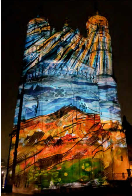
Ungewohnte Ansichten des Doms: der Westchor in Farben ...

Am 7. + 8. September 2018 fand ein weiteres Highlight im Jubiläumsjahr des Doms statt: LichtKlang.Dom. Ich durfte dieses Ereignis am Freitagabend als Teilnehmer um 21.30 Uhr erleben und war schlichtweg begeistert: