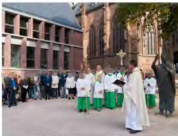
Einweihung des Domplatzes am 7. Oktober

Auch der neu gestaltete Domplatz konnte im Oktober eingeweiht werden. Der neue Plattenbelag ist verlegt, ein barrierefreier Zugang von der Andreasstraße geschaffen, der Zugang als ein attraktives Entrée zum Südportal des Doms neu gestaltet worden. In diesen