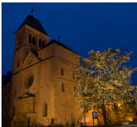
St. Martinskirche im Advent

Die MSS-Musikkurse des Eleonorengymnasiums Worms lassen im Dom weihnachtliche Vokalmusik von Gregorianik bis Gospel erklingen.