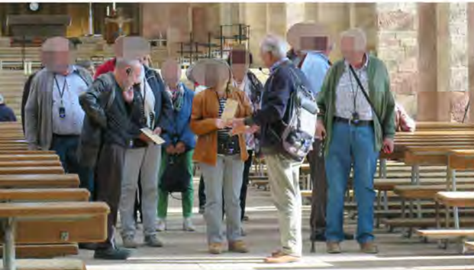
Führung im Speyerer Mariendom

Speyer und der Speyerer Dom waren das Ziel der Pfarrwallfahrt. Nachdem Bischof Burchard die Familie der Salier aus ihrem angestammten Sitz Worms vertrieben hatte, wo sie im Wormser Dom auch ihre Familiengrablege hatten, baute Kaiser Konrad für sich und seine Nachkommen – mittlerweile zum Kaiserhaus aufgestiegen – den Speyerer Dom als neue Grablege. Beide Dome sind daher eng verwandt.