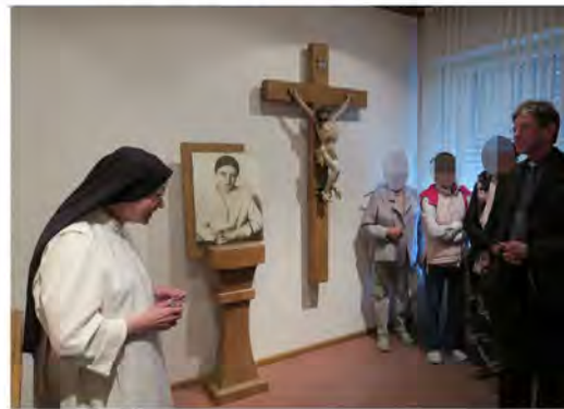
Empfang und Führung durch Schwester Raphaela in der Edith Stein-Gedenkstätte im Dominikanerkloster St. Magdalena