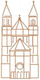
Dom St. Peter