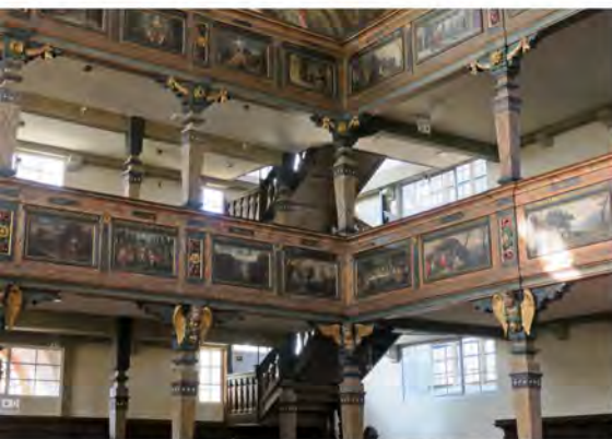
Die evangelische Dreifaltigkeitskirche als eine Art Zwillingebau zur Wormser Dreifaltigkeitskirche zeigt, wie diese vor ihrer Zerstörung aussah.