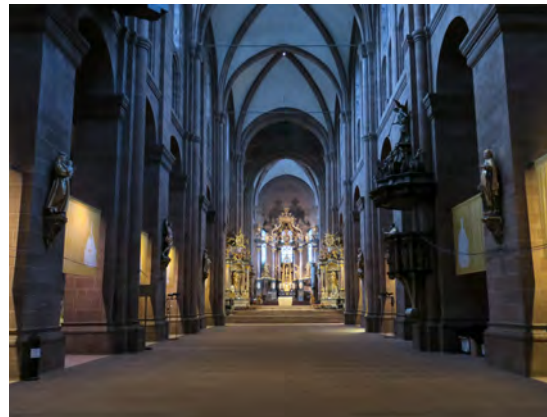
... und das Innere des Doms leer, ohne die gewohnten Kirchenbänke

Am Samstag durfte ich das Ganze als ehrenamtliche Helferin erleben: Alle vier Vorstellungen waren sehr gut besucht. Die Gäste standen teils schon 30 min vor Einlass in der Schlossgasse. Leider war es bei der Vorstellung um 20 Uhr noch viel zu hell, um die Wirkung der Bilder zu erkennen. Da dies am Freitag schon festgestellt wurde, gab es am Samstag