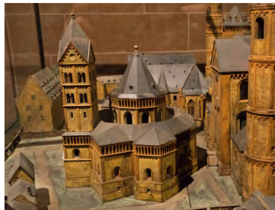
Am Dom-Modell wird sichtbar, welchen Platz die Johanniskirche einst einnahm.