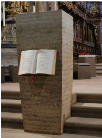
Der neue Ambo wird zuerst gesegnet.