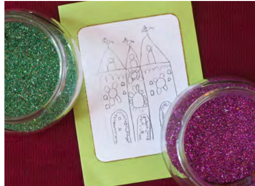
Von den Kindergartenkindern gestaltete Karte & Glitzer

Schicht 11: Weihrauch durch die Messdiener, Stück eines Zeltlagerbanners durch die Jugend, alte Orgelpfeife durch Verein Musik am Dom, Kerzenwachs durch den ökumenischen Kreis des Weltgebetstags,