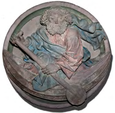
Apostel Petrus, Schluss-Stein aus dem ehemaligen Domkreuzgang, um 1515

bracht: Wir haben wichtige Themen zusammen getragen, die uns in den kommenden Jahren beschäftigen werden. So wird es darum gehen, für die unterschiedlichen Menschen, denen wir in unseren Gemeinden begegnen, zielgruppenorientierte Ange-