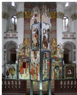
Passionsaltar, Gesamtansicht und Detail

das Projekt mit initiiert hat, wird mit einer meditativen Betrachtung in die Symbolsprache des Altars einführen. Die genauen Termine werden rechtzeitig bekannt gegeben.