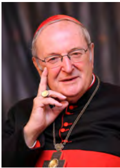
Joachim Kardinal Meisner, emeritierter Erzbischof von Köln

Mein Lieblingslied im neuen Gotteslob ist „Segne du, Maria, segne mich, dein Kind“ (535). Es ist – das habe ich mir sagen lassen – das am meisten gewünschte Lied im neuen Gotteslob. Meine Liebe zu dem Lied hängt mit