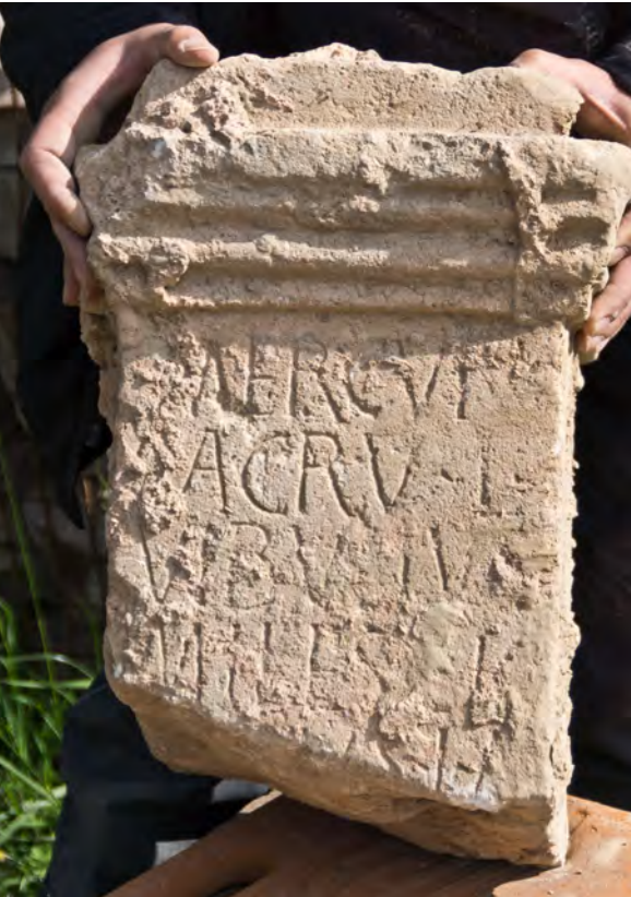
Fragment eines römischen Altars

wurden, konnten leider keine Gebäude oder Fundamente aus römischer Zeit mehr gefunden werden. Dass hier aber mit dem römischen Forum und in seiner Nähe einem Tempelbezirk auch schon das Zentrum der römischen Civitas stand, darauf deuten einige kleine, aber feine Funde hin, wie etwa ein in eine mittelalterliche Mauer verbauter Stein, der ursprünglich zu einem römischen Weihealtar gehört haben dürfte. Seine fragmentarische Inschrift lässt noch deutlich erkennen, dass er Merkur, dem römischen Gott des Handels geweiht war. Beinahe in den letzten Grabungstagen stieß man noch auf eine römische Abfallgrube, in der ein vollständig erhaltener kleiner römischer Krug gefunden wurde. Optisch unscheinbar, aber historisch eine kleine Sensation ist auch die letzte Entdeckung: Da der nach dem Baugesetz vorgeschriebene Sicherheits- und Gesundheitskoordinator aus Sicherheitsgründen die Abböschung der Baugrube zum Kreuzgang hin etwas weiter angelegt haben wollte, musste hier