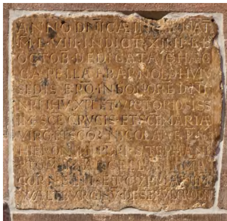
Grundstein zum Bau der Nikolauskapelle, 11. Jahrhundert

Wenn alles im Plan bleibt, wird bis Weihnachten 2016 der Rohbau des Hauses stehen. Dabei wird das Haus zunächst als Betonbau hochgezogen und mit dem Dach versehen. Ab Januar 2017 folgen dann der Ausbau und die Fassadengestaltung. Wir sind uns bewusst, dass es durch diesen Ablauf in der öffentlichen Diskussion gegen Ende des Jahres sicher noch einmal spannend werden wird: Wenn das künftige Haus zunächst gleichsam als