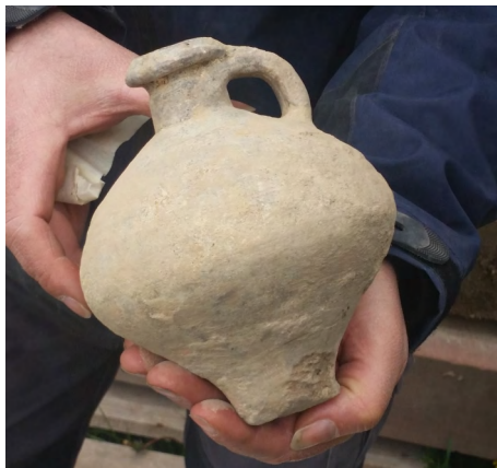
Römischer "Abfall": eine vollständig erhaltene Amphore

noch etwa zwei Meter weiter als ursprünglich geplant in den Bereich des Kreuzgangs eingegraben werden. Dabei stieß man, wie erwartet, auf einige weitere Gräber. Unter diesen aber ist, für Fachleute leicht erkennbar, ein früheres Fußbodenniveau aufgetaucht, das zum frühen, romanischen Kreuzgang gehört haben dürfte. Damit lässt sich dessen Lage, um die es bislang nur Spekulationen gab, nun auch rekonstruieren; für die Bauforschung eine höchst interessante Erkenntnis aus den letzten Grabungstagen.