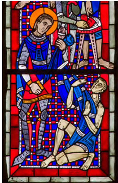
Hl. Martin: Werke der Barmherzigkeit (Detail), Martinkirche, Heinz Hindorf

Sonntag, 13.11. 10:30 Uhr: Hochamt zum Patrozinium mit dem Martinschor, anschließend Martinsgansessen im Martinushaus