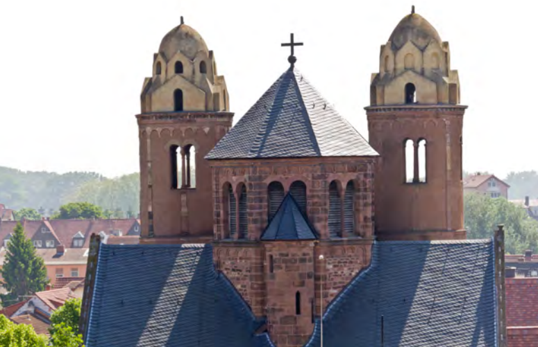
Dominikanerkloster St. Paulus