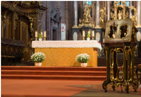
Altarraum im Wormser Dom

Der Altar ist in einer Kirche der natürliche Mittelpunkt: Als Ort für die Feier der Eucharistie ist er das zentrale Christussymbol. Deshalb heißt es in der Grundordnung für das Römische Messbuch: Der Altar soll durch seinen Ort und durch die Qualität seiner Gestaltung der Mittelpunkt der feiernden Gemeinde sein, „dem sich die Aufmerksamkeit der ganzen Versammlung der Gläubigen von selbst zuwendet“ (GORM 299). Er soll feststehend, unverrückbar und mit der Erde verbunden sein.