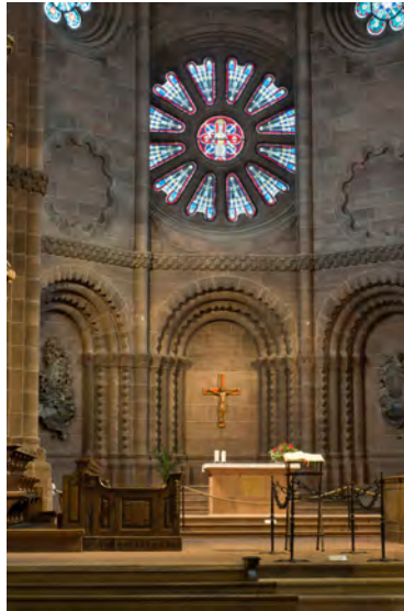
Blick in den Westchor des Wormser Doms