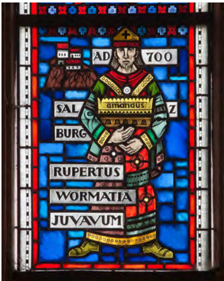
Heiliger Rupert, Geschichtsfenster im Dom (Heinz Hindorf)

An einem 27. März starb der Hl. Rupert, Bischof von Worms. Das genaue Todesjahr ist nicht überliefert, am wahrscheinlichsten scheint das Jahr 717 zu sein. Rupert hatte seinen Bischofssitz in Worms verlassen, war zunächst nach Regensburg gezogen