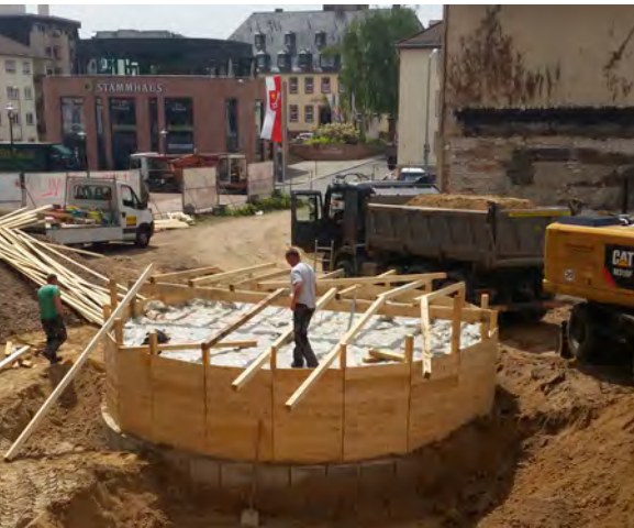
Taufpiscina, gut verpackt für die Bauphase

Mittlerweile ist auch die Fläche für die Fundamentplatte eingeebnet. Die Grundleitungen, die unter der Bodenplatte liegen werden, werden nun gelegt; dann wird in diesen Tagen mit insgesamt 260 m 3 Beton – das sind mehr als 65 Lastwagenladungen – die Fundamentplatte gegossen, die das Haus tragen wird. Unmittelbar nach Abschluss dieser Arbeiten wird begonnen, die Wände hochzuziehen. Den Beginn der Hochbauarbeiten markiert die Grundsteinlegung, zu der wir die ganze Gemeinde sehr herzlich einladen. Einen Grundstein zu setzen, hat eine lange Tradition. Im Dom selbst kennen wir den Grundstein für den Neubau der Nikolauskapelle im 11. Jahrhundert; erst vor wenigen Jahren wiederentdeckt wurde im Lapidarium des Kreuzgangs der alte Grundstein für die gotische Neugestaltung des Kreuzgangs aus dem 15.