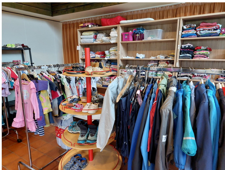
Foto: Viel Ware auf kleinem Raum: stabile Regale und Kleiderstände machen dies möglich.