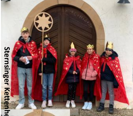
Sternsinger Kettenheimer Grund