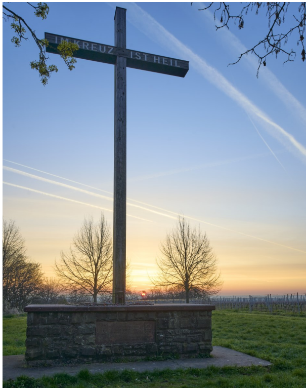
das Kreuz am Lörzweiler Hohberg