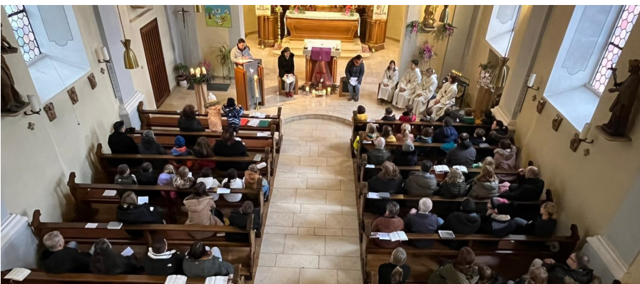
Familiengottesdienst in Mommenheim