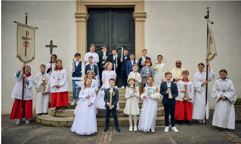
Kommunionkinder aus Gau-Bischofsheim und Harxheim