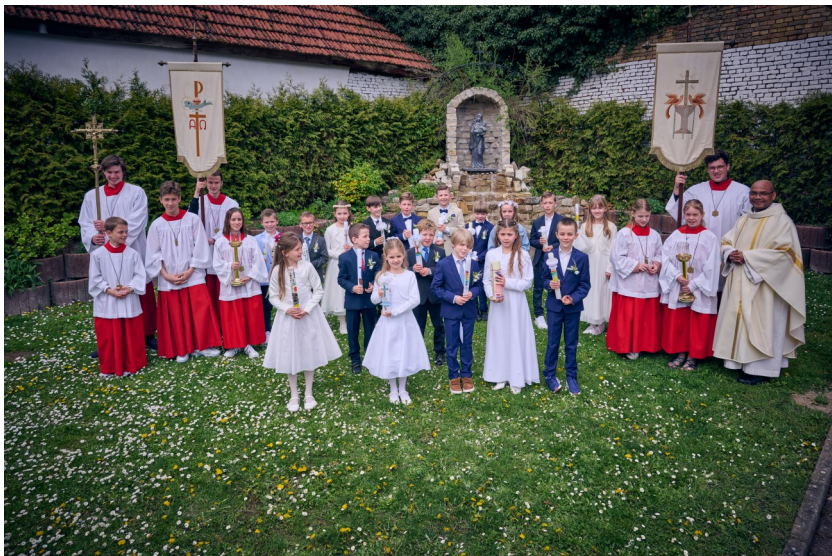
Kommunionkinder aus Lörzweiler und Mommenheim