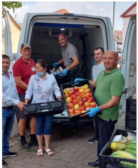
Bild: Tafel Kelsterbach

Nicht vergessen werden dürfen auch die vielen vielen kleinen Dinge, die wie ganz selbstverständlich von Haupt- und Ehrenamtlichen organisiert aber nicht so offensichtlich wahrgenommen werden.