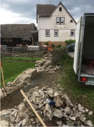
Foto: Abtransport der Natursteinmauer

April 2019/September 2019 - Natursteine für den Weg wurden aus dem Odenwald geholt. Sie stammten von einer alten Mauer, die abgerissen werden sollte.