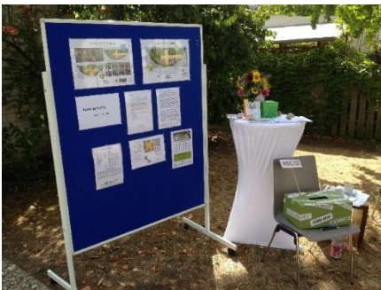
Foto: Vorstellung der Entwürfe am Gemeindefest

Ebenso konnten sich Interessierte für die Umsetzung der neuen Gartengestaltung und für die Pflege melden.