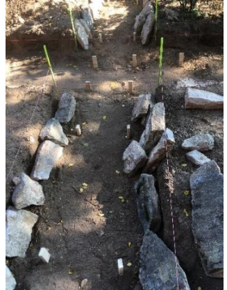
Foto: Vermessung des Weges

Nachdem der Weg vermessen und abgesteckt wurde, konnte die Erde abgetragen werden. Von der Gärtnerei Löwer gespendete 80 Lavendel wurden gepflanzt. Die Natursteine wurden als Wegbegrenzung aufgestellt.