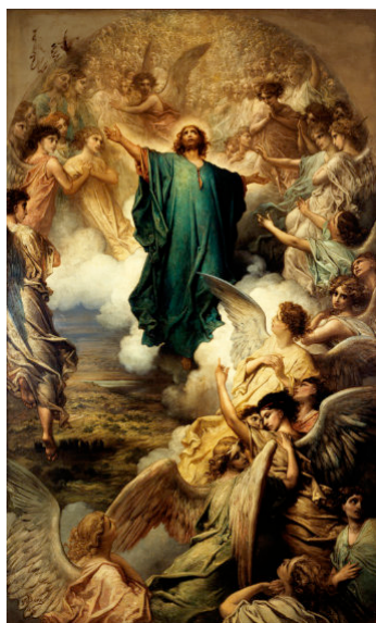
Gustave Doré, Public domain, via Wikimedia Commons