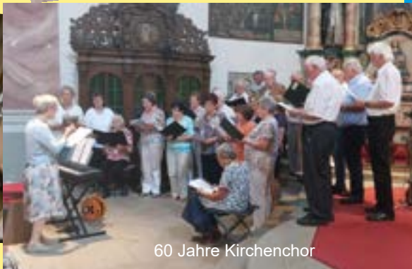
60 Jahre Kirchenchor