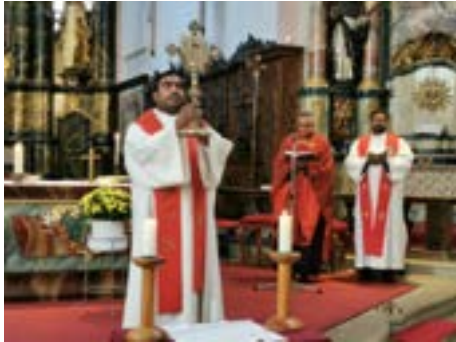
Segen mit der Kreuzreliquie