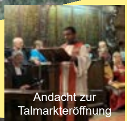
Andacht zur Talmarkteröffnung