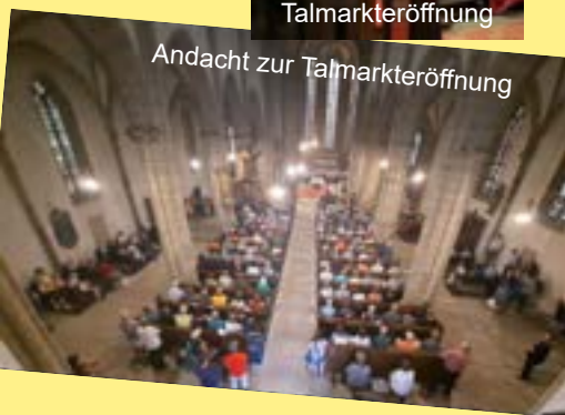
Andacht zur Talmarkteröffnung