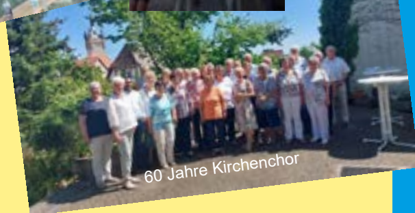
60 Jahre Kirchenchor