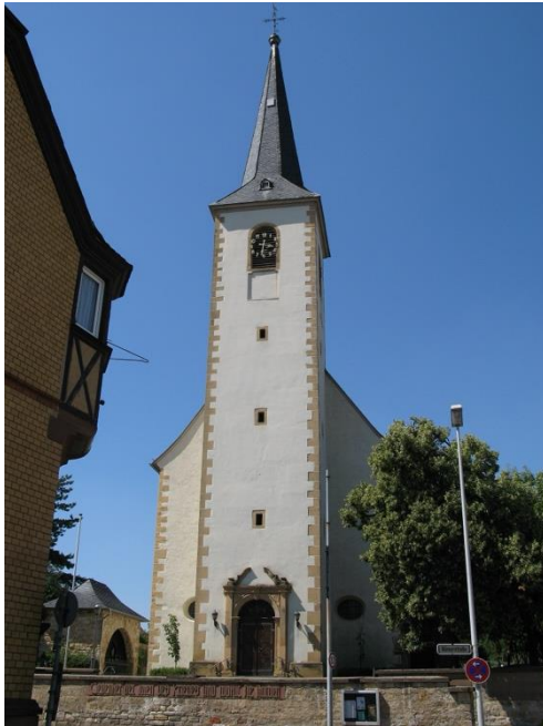
Kirche St. Laurentius