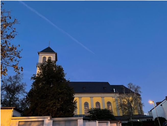
Kirche Mariä Himmelfahrt