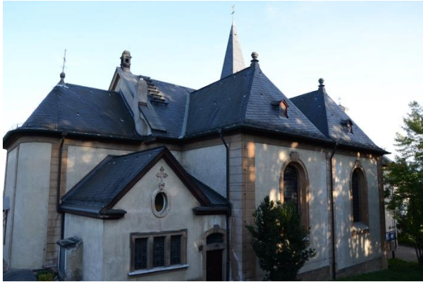
Kirche Mariä Heimsuchung