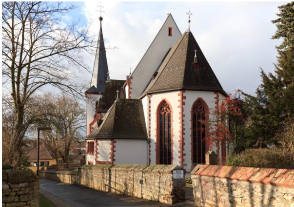
Kirche St. Pankratius