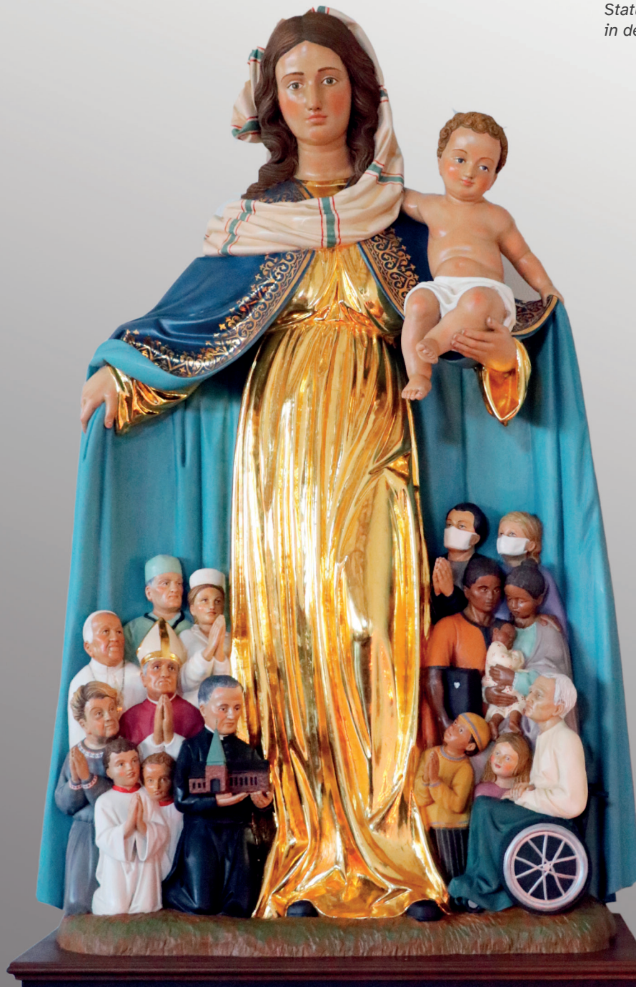
Statue der Hl. Maria in der Kirche St. Marien