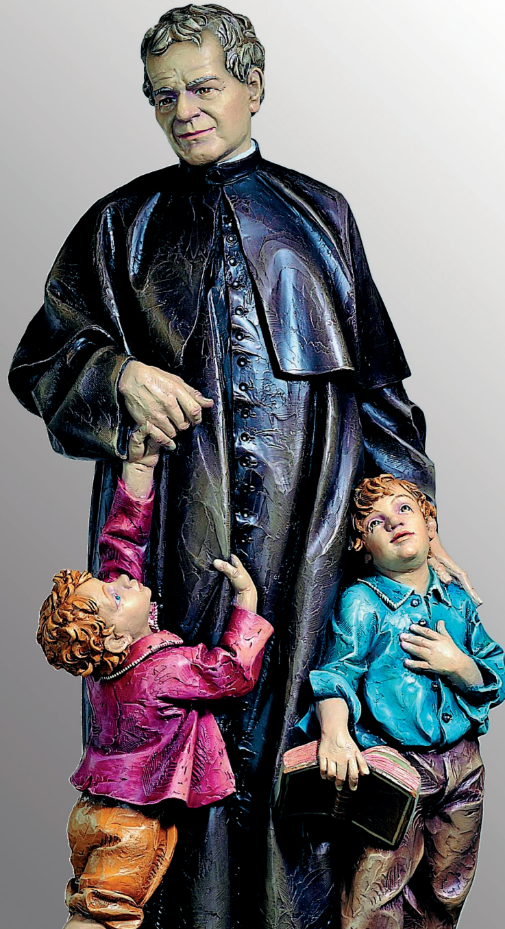
Statue des Hl. Don Bosco