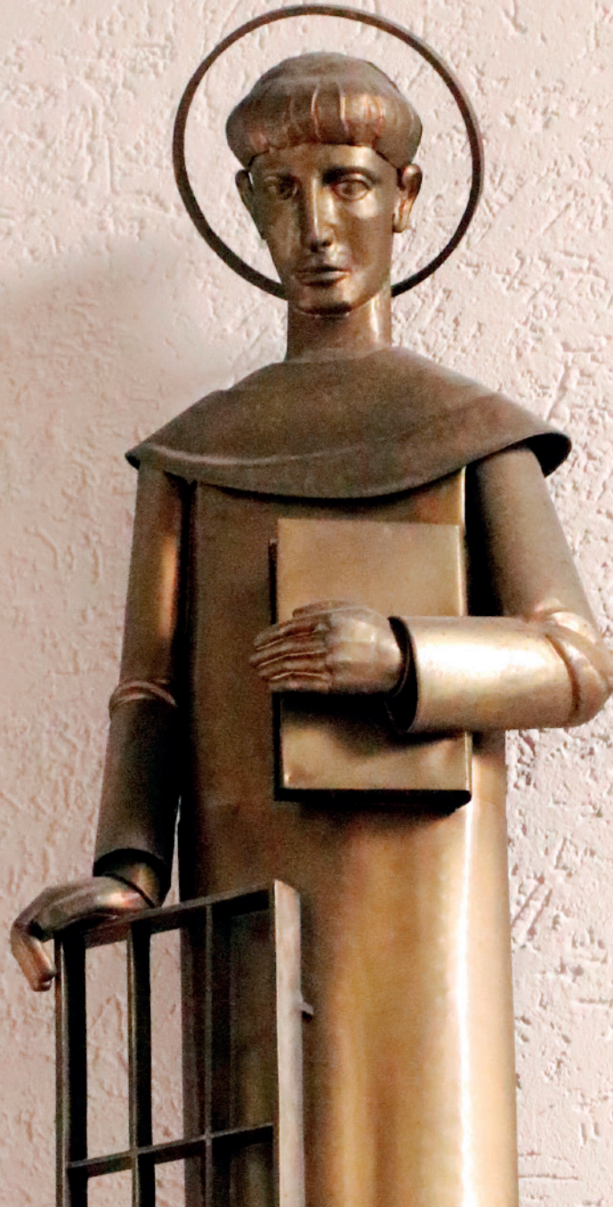
Statue des Hl. Laurentius in der Erasmus Alberus Kirche