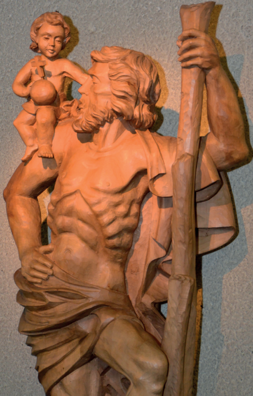
Statue des Hl. Christophorus in der Kirche Sankt Christoph