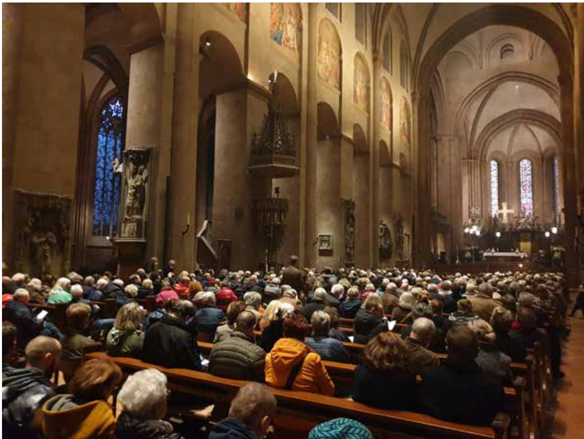
Orgelkonzert im Mainzer Dom

Am Sonntag, den 13. November 2022, lud der Landesmusikrat Rheinland-Pfalz bei freiem