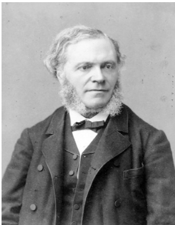
César Franck (1822-1890)