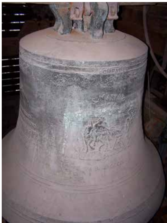
Martinus-Glocke im Mainzer Dom

Am „Tag des offenen Denkmals“ (11. September 2022), der in diesem Jahr unter dem Thema „KulturSpur“ stand, konnten in Mainz auch Glocken als besondere Denkmäler hörbar gemacht werden.