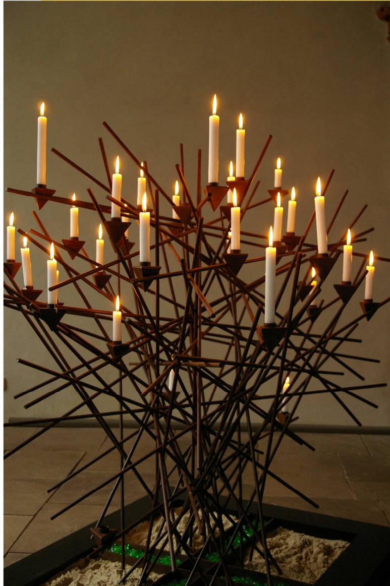
„Dornbusch“ im Kapitelsaal des Klosters Walkenried

Spirituelle Impulse für kirchliche Gruppen und Gremien