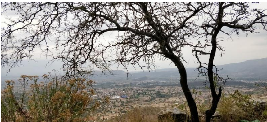
Ausflug nach Sipe Sipe

Auch wenn ich erst knapp 4 Wochen hier bin, fühle ich mich schon super wohl und bin gespannt, was ich in den nächsten Wochen noch alles erleben werde.