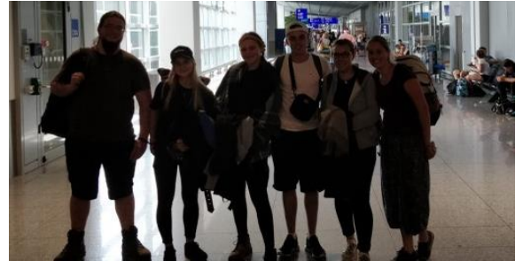
Wir sechs am Frankfurter Flughafen