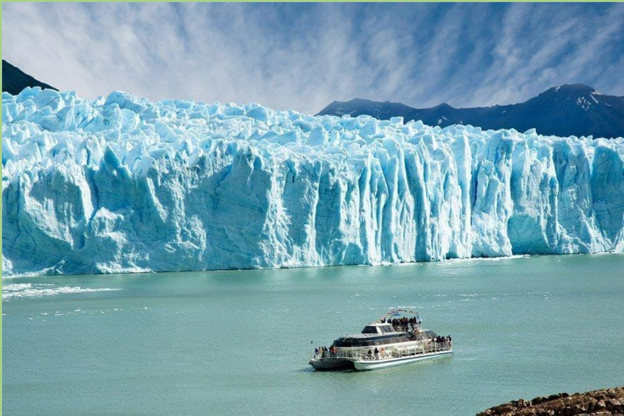
Abbildung 5

Von dort ging es zum unglaublich beeindruckenden Gletscher Perito Moreno im Nationalpark los glaciers, ob dessen Schönheit wir die Öffnungszeiten der Einrichtung glatt vergaßen und schon hofften unser Zelt illegaler weise unbemerkt in der Nähe des Gletschers aufschlagen zu können.