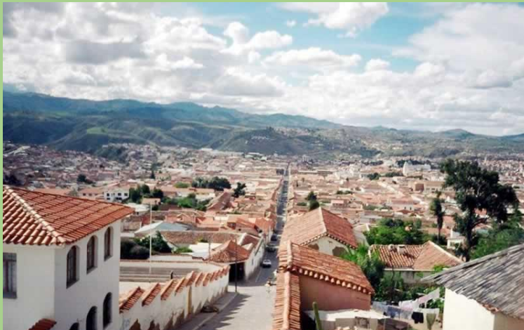
Abbildung 1

Willkommen zu meinem kleinen Reisebericht, denn den Hauptteil dieses Monats durfte ich mit einer Freundin auf einem Trip durch Chile und Argentinien verbringen. Da wir leider einige Kommunikationsschwierigkeiten technischer Art haben und ich sie nicht fragen konnte ob sie mit der namentlichen Erwähnung in meinem Bericht einverstanden ist nenne ich sie im Folgenden aus Datenschutzgründen [REDACTED].