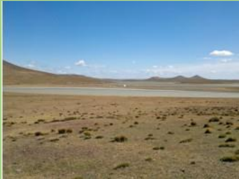
Abbildung 3

Unser erstes Ziel war die dort lebenden Pinguine zu sehen. Nachdem wir uns einen Tag in der Stadt aufgehalten hatten, um Proviant und Informationen zu besorgen machten wir uns auf den Weg zur einzigen permanenten Königspinguinkolonie Südamerikas. Da uns die geführte Tour aber zu langweilig und mit ca.100€ pro Person für eine Stunde Aufenthalt am Zielort auch zu teuer war, beschlossen wir per Anhalter an unser Ziel zu kommen. Allerdings hatten wir nur eine Karte (ja so richtig aus Papier), auf der kein Maßstab angegeben war und so unterschätzten wir die Wegstrecke etwas, die sich als mehr als 400km lang entpuppte. Was wir ganz im Gegensatz dazu überschätzten war das Verkehrsaufkommen das sich bis auf ein paar LKW in der Stunde gegen null bewegte. Und so verbrachten wir eine Nacht in der windigen Pampa Feuerlands ca. 15 Kilometer von unseren gefiederten Zielen entfernt.