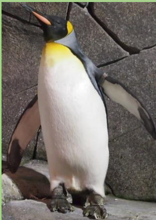
Abbildung 4

Am nächsten Vormittag hatten wir dann die Gelegenheit den sehr schön angelegten Schutzpark für genannte Pinguine zu besuchen. Nachdem wir uns am eleganten Flug der wasserscheuen Vögel satt gesehen hatten ging es auf die gleiche Weise zurück Richtung Festland.