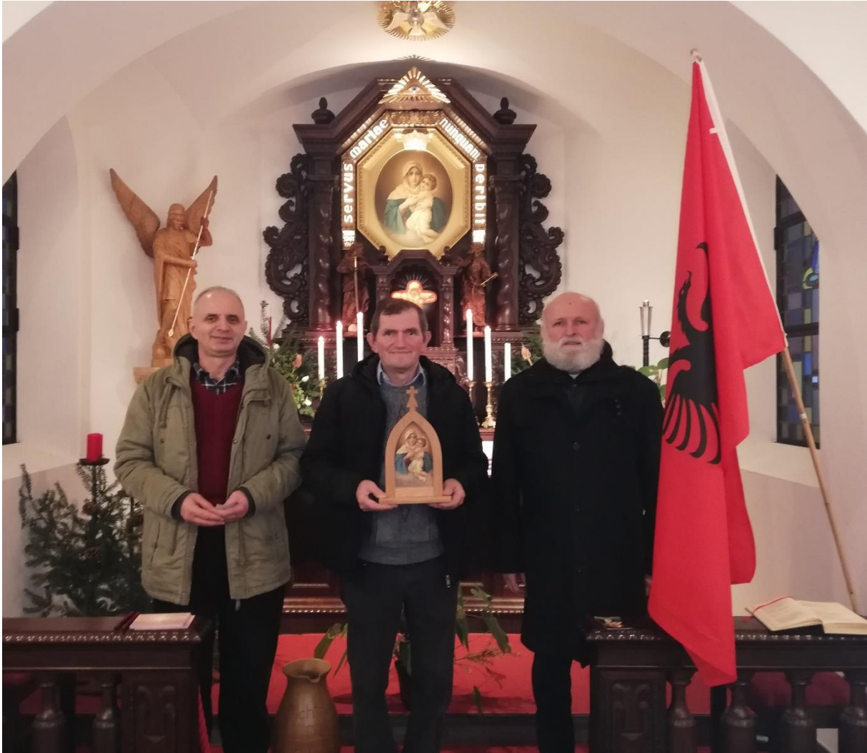
Bild vom Taborheiligtum in Schönstatt auf dem Berg der Männer Pamje nga Shenjtoria Tabor në Shënsttad per mbi malin e burrave